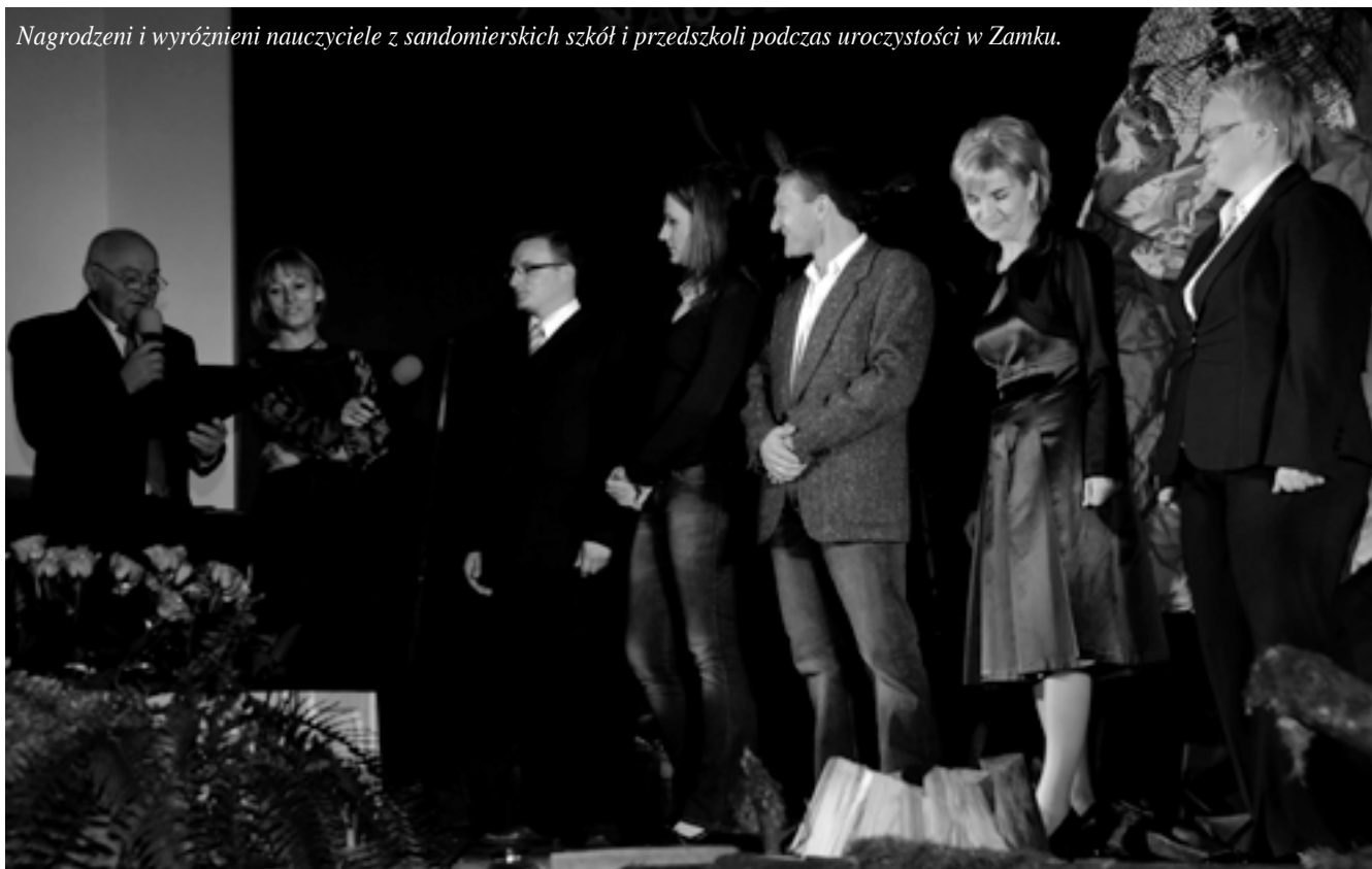
Nagrodzeni i wyróżnieni nauczyciele z sandomierskich szkół i przedszkoli podczas uroczystości w Zamku.

Z okazji Dnia Edukacji Narodowej wszystkim nauczycielom i pracownikom oświaty składamy najlepsze życzenia!