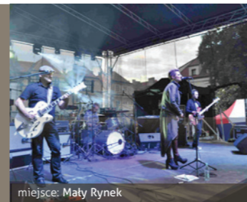
miejsce: Mały Rynek

Muzyczna impreza plenerowa dla dzieci, młodzieży i dorosłych. Zakończenie Wakacji jest doskonałym pretekstem do wspólnej zabawy bez względu na wiek.