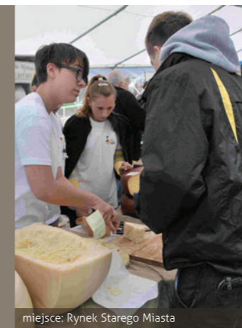
miejsce: Rynek Starego Miasta

Aby uświadomić bogactwo niezliczonych form mleka pod koniec czerwca Sandomierz stanie się stolicą dobrego smaku za sprawą prezentacji najlepszych producentów sera z całej Polski i wielu zagranicznych gości. Dodatkowe atrakcje Festiwalu stanowić będą: profesjonalne sympozjum serowarskie, warsztaty degustacyjne, liczne kiermasze na Rynku Starego Miasta oraz kulturalne imprezy towarzyszące.