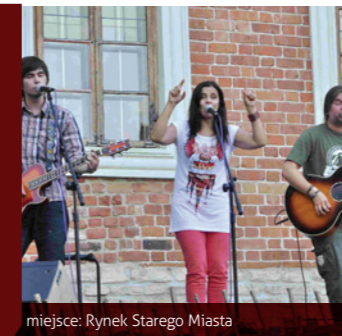
miejsce: Rynek Starego Miasta

Niemal w każdy weekend sezonu letniego scena plenerowa na sandomierskiej Starówce gości artystów prezentujących rozmaite gatunki muzyczne. Genius loci jednego z najpiękniejszych i najstarszych miast w Polsce to właśnie takie niepowtarzalne spotkania ze sztuką.