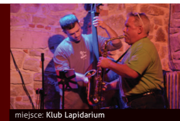
miejsce: Klub Lapidarium

Energetyzujący jazz na żywo, sprawiający, że jesień stanie się naszą ulubioną porą roku.