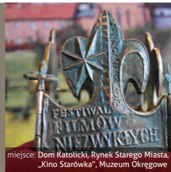
miejsce: Dom Katolicki, Rynek Starego Miasta, „Kino Starówka”, Muzeum Okręgowe

Uczta dla miłośników kina, podczas której organizowane są spotkania autorskie ze znakomitymi osobowościami polskiej kinematografii, liczne projekcje filmowe, ogólnopolskie warsztaty filmowo-muzyczne, koncerty oraz wiele innych atrakcji.