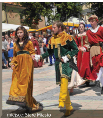
miejsce: Stare Miasto

Festyn z udziałem twórców rękodzieła artystycznego, braci rycerskiej oraz setek pasjonatów narodowej kultury i tradycji. Inscenizacje historyczne, żywe szachy, pokazy walk rycerskich, tańca dworskiego, koncerty muzyczne i wiele innych atrakcji.