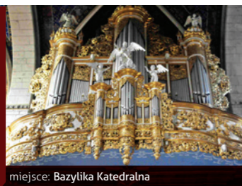
miejsce: Bazylika Katedralna

Wielka uczta dla miłośników muzyki organowej, której brzmienie we wnętrzach sandomierskiej Bazyliki Katedralnej daje niepowtarzalne przeżycie.