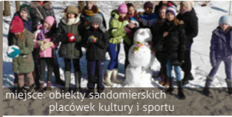
miejsce: obiekty sandomierskich placówek kultury i sportu

Cykl imprez sportowych, artystycznych i rekreacyjnych organizowanych dla dzieci oraz młodzieży w okresie ferii zimowych.