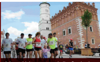
miejsce: obiekty sportowe i ulice Sandomierza

Impreza dla wielbicieli biegania. Trasa biegu wiedzie m.in. malowniczymi uliczkami Starego Miasta w Sandomierzu, odbywa się w ramach ogólnopolskiej akcji „Polska biega”.