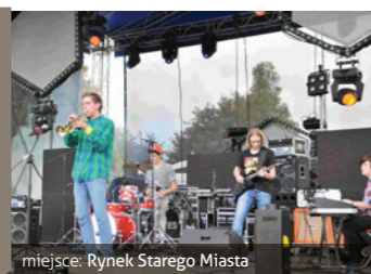
miejsce: Rynek Starego Miasta

Impreza plenerowa, konkursy i zabawy dla dzieci, prezentacje lokalnych zespołów artystycznych oraz koncerty gwiazd polskiej sceny muzycznej.