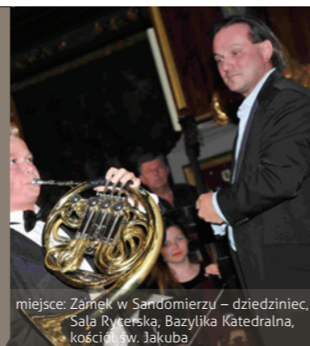
miejsce: Zamek w Sandomierzu – dziedziniec, Saja Ryteńska, Bazylika Katedralna, kościół św. Jakuba

Największe muzyczne wydarzenie miasta, prezentujące co roku różne style i gatunki muzyczne z naciskiem na muzykę klasyczną. Festiwal obejmuje od ośmiu do dziesięciu koncertów, odbywających się w plenerze lub w zabytkowych salach sandomierskich obiektów.