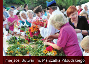
miejsce: Bulwar im. Marszałka Piłsudskiego,

Impreza plenerowa nawiązująca do starej tradycji zabaw podczas najkrótszej w roku nocy. Tego wieczoru organizowane są liczne atrakcje, konkursy – w tym na najpiękniejszy wianek.