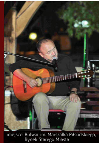
miejsce: Bulwar im. Marszałka Piłsudskiego, Rynek Starego Miasta

To wielobarwna, wielokulturowa i fascynująca podróż przez bliskie i dalekie zakątki kuli ziemskiej. Jest interdyscyplinarną imprezą plenerową, która oferuje spojrzenie na rozmaite kultury oraz Muzykę Świata z perspektywy miasta, które od zarania dziejów było „świadkiem” spotkań wędrowców z mieszkańcami nadwiślańskiego grodu.