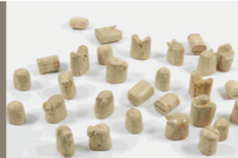
miejsce: Sala Rycerska, Zamek

Wiosenne zmagania o „Szachy Królowej Jadwigi” nawiązujące tradycją do wspaniałych potyczek i turniejów oraz sandomierskiego zestawu bierek z XII wieku.