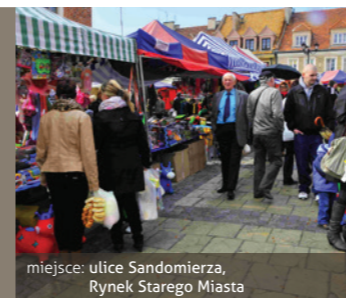
miejsce: ulice Sandomierza, Rynek Starego Miasta

Dwudniowe obchody ku czci bł. Wincentego Kadłubka, patrona miasta i współpatrona Diecezji Sandomierskiej zakończony tradycyjnym, wielobarwnym jarmarkiem na Ryнку Starego Miasta.