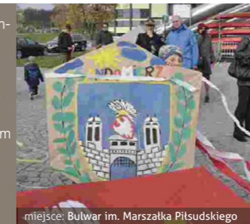
miejsce: Bulwar im. Marszałka Piłsudskiego

Rodzinne spotkanie w jesiennej aurze, w czasie którego panują idealne warunki do tego, by na sandomierskim niebie zawisły różnobarwne latawce. Wydarzenie, które sprawi dużo radości dzieciom i będzie magiczną podróżą do czasów dzieciństwa dla dorosłych.