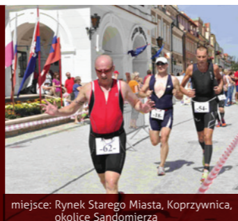
miejsce: Rynek Starego Miasta, Koprzywnica, okolice Sandomierza

Celem imprezy jest propagowanie zdrowego stylu życia poprzez sport i rekreację. Zawodnicy rywalizują w trzech dyscyplinach: pływaniu, jeździe na rowerze i biegach.