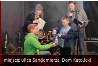
miejsce: ulice Sandomierza, Dom Katolicki

Ogólnopolska cykliczna impreza charytatywna, podczas której organizowane są licytacje oraz koncerty. W całym mieście kwestuje kilkudziesięciu wolontariuszy WOŚP.