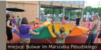
miejsce: Bulwar im. Marszałka Piłsudskiego

Festyn dla dzieci, konkursy i zabawy przy muzyce.