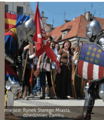
miejsce: Rynek Starego Miasta, dziedziniec Zamku,

Cykl imprez rycerskich organizowanych przez Chorągiew Rycerstwa Ziemi Sandomierskiej, które obejmują: widowiska historyczne, musztrę paradną i bojową, uroczystą zmianę wart.