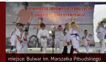
miejsce: Bulwar im. Marszałka Piłsudskiego

Impreza rekreacyjno-sportowa o charakterze rodzinnym.