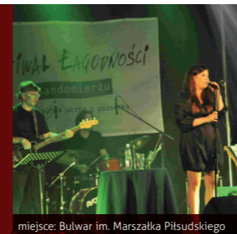
miejsce: Bulwar im. Marszałka Piłsudskiego

Zwany również „Bezalkoholową ucztą z piosenką” to święto miłośników piosenki artystycznej. Koncerty zaproszonych gości, które z zasady charakteryzuje bogata interpretacja dostarczająca słuchaczom najwyższych emocji i wrażeń.