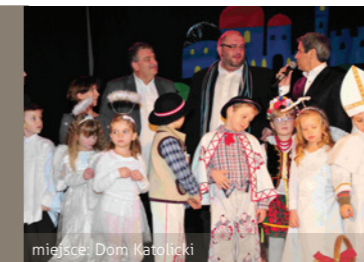
miejsce: Dom Katolicki

W ten magiczny wieczór usłyszymy najpiękniejsze polskie kołędy i pastorałki. Nie zabraknie również tych, które są bezpośrednio związane z Sandomierzem. Zapraszamy do wspólnego kołędowania!