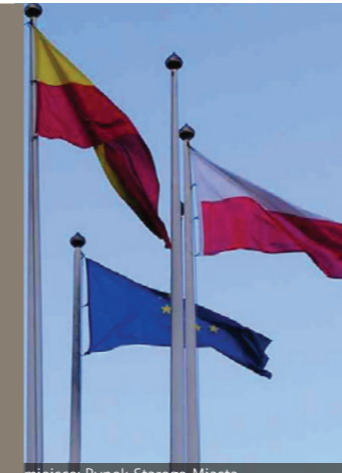
miejsce: Rynek Starego Miasta, dziedziniec Zamku, Bulwar im. Marszałka Piłsudskiego

Celem imprezy jest promocja funduszy unijnych i projektów zrealizowanych w regionie przy dofinansowaniu środków unijnych oraz wzrost świadomości uczestników wydarzenia w tym zakresie. Wydarzeniu o charakterze edukacyjno-kulturalnym w formie całodniowego pikniku rodzinnego towarzyszyć będą m.in. występy artystyczne, a końcowym akcentem imprezy będzie plenerowy koncert jednej z uznanych polskich grup muzycznych i pokaz mody.