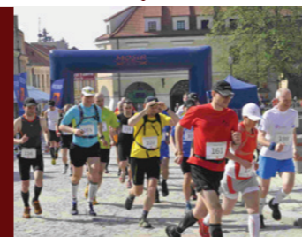
miejsce: Rynek, ulice Sandomierza, Park Piszczele, ciąg pieszo-rowerowy

Impreza sportowa organizowana w celu popularyzacji aktywnego wypoczynku na miejskich obiektach sportowych, w programie imprezy m.in. biegi sportowe i zawody MTB.