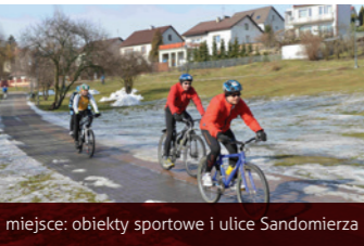
miejsce: obiekty sportowe i ulice Sandomierza

Celem imprezy jest propagowanie zdrowego stylu życia poprzez sport i rekreację. Zawodnicy rywalizują w trzech dyscyplinach: pływaniu, jeździe na rowerze i biegach.