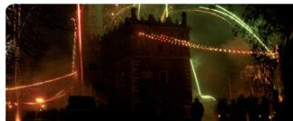
miejsce: Rynek Starego Miasta

- sylwestrowa impreza plenerowa połączona z zabawą taneczną, pokazem sztucznych ogni oraz składaniem noworocznych życzeń.