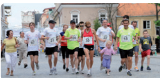
miejsce: Bulwar im. Marszałka Piłsudskiego

- impreza rekreacyjno-sportowa o charakterze rodzinnym, podczas której uczestnicy biorą udział w zawodach sportowych.