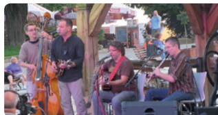
miejsce: Kluby, plenery i zakątki Sandomierza, Kino „Starówka”

- muzyka świata zyskuje coraz większą liczbę zwolenników, a nawet „wyznawców”. Jej podstawowym atutem jest różnorodność, dlatego każdy z koncertów jest inny i za każdym razem wyjątkowy.