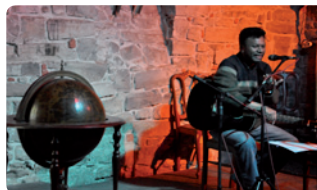
miejsce: Klub Lapidarium, Kino „Starówka”

- zapraszamy pasjonatów egzotyki, odległych, a czasem i bliskich geograficznie krajów na spotkania z tymi, dla których podróże to sposób na życie. Projekcje filmów i slajdów oraz opowieści i anegdoty tych, dla których często ważniejsza jest droga, a nie cel.