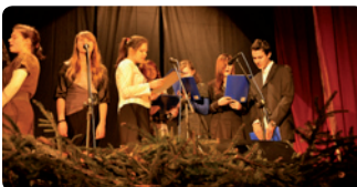
miejsce: Zamek w Sandomierzu – Sala Rycerska

- w ten magiczny wieczór usłyszymy najpiękniejsze polskie kolędy i pastorałki. Nie zabraknie również tych, które są bezpośrednio związane z Sandomierzem. Zapraszamy do wspólnego kolędowania!