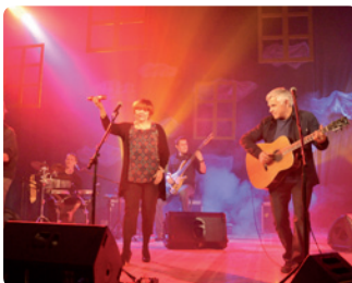
miejsce: Dom Katolicki

- zwany również „Bezalkoholową uczta z piosenką” to święto miłośników piosenki artystycznej. Koncerty zaproszonych gości, które z zasady charakteryzuje bogata interpretacja dostarczająca słuchaczom najwyższej próby emocji i wrażeń.