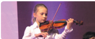
miejsce: Zamek w Sandomierzu – Sala Rycerska

- występ uzdolnionych muzycznie młodych artystów z całego kraju.